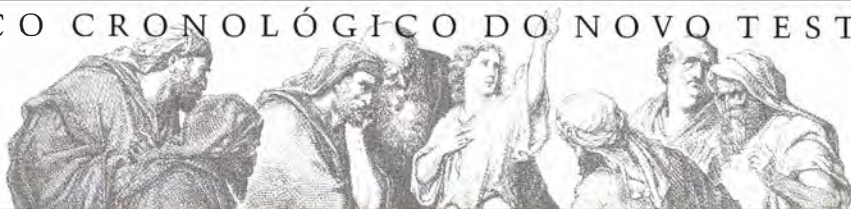
GRÁFICO CRONOLÓGICO DO NOVO TESTAMENTO